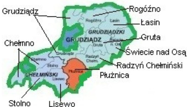
Rys. 2. Gminy tworzące obszar LSR

Obszar LGD znajduje się w środkowej części województwa kujawsko – pomorskiego, w powiecie chełmińskim, grudziądzkim ziemskim i wąbrzeskim. Łącznie obszar objęty działalnością LGD wynosi 1146 km 2 , w tym: Chełmno 113 km 2 , Grudziądz 165 km 2 , Gruta 124 km 2 , Lisewo 86 km 2 , Łasin 137 km 2 , Płużnica 120 km 2 , Radzyń Chełmiński 91 km 2 , Rogóźno 116 km 2 , Stolno 99 km 2 , Świecie nad Osą 95 km 2 .